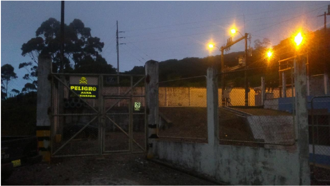
PATIO DE 13.8 KV EXISTENTE